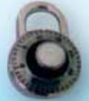
أقفال كبس Pad Locks